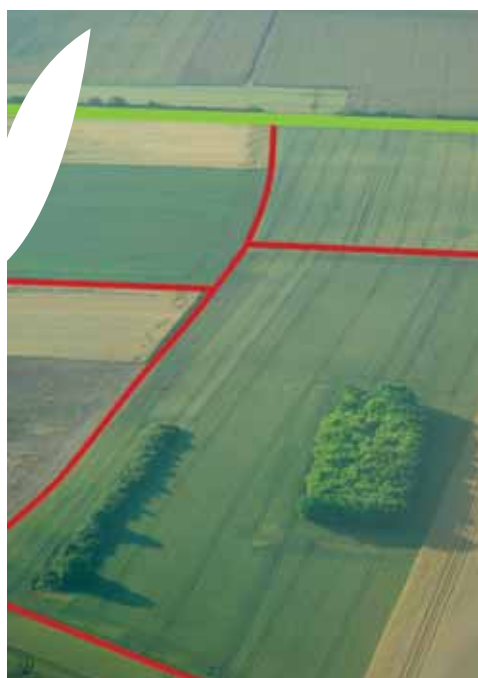
Importance des bordures de champs dans les continuités écologiques.

de floraison influencent beaucoup ces populations qui ne peuvent pas compter sur le potentiel alimentaire des cultures (trop faible ou trop court dans le temps). La présence de légumineuses (luzerne, trèfle) sur une bordure de champ est favorable à l'abondance et à la diversité de ces espèces. Il convient de mettre en place une gestion qui doit s'efforcer de ne pas éliminer trop précocement les inflorescences porteuses de pollens et de nectars indispensables.