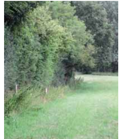
Bordure de prairie adjacente à une haie (Perche).