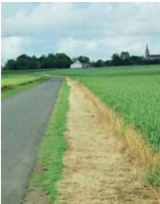
A bannir : l'entretien chimique.

• L'entretien chimique des bordures de champs est fortement déconseillé . Cette pratique peut entraîner une pollution de l'eau, et une érosion due à la mise à nu du sol. Non seulement une telle pratique élimine la plupart des espèces végétales, mais favorise aussi les espèces compétitives et adventices tel que le brôme stérile. En dernier recours, utiliser de faibles doses d'herbicides sélectifs et cibler l'application.