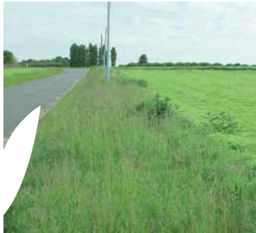
Les bordures de champs adjacentes à une route : un maillage important pour la circulation de la biodiversité !