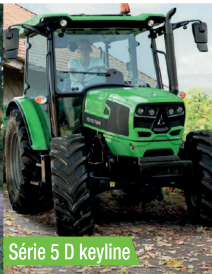
Série 5 D keyline