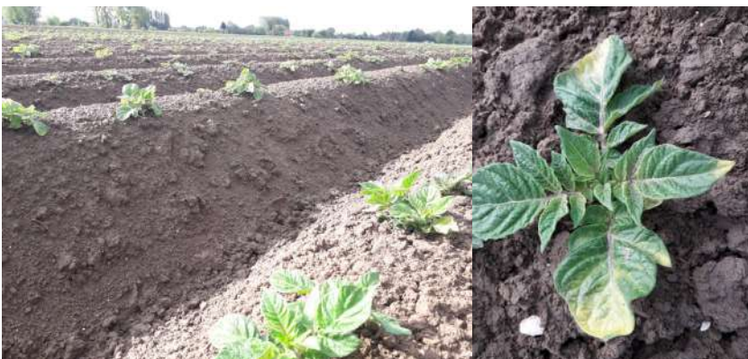
Fontane plantée le 1er avril—Richebourg (62) 100% de levée, phytotoxicité herbicide

METEO : Quelques averses sont encore annoncées jusque jeudi avec des températures assez fraîches autour de 13°C l'après-midi. A compter de vendredi, les températures devraient remonter progressivement (19 à 20°C pour le week-end) et le temps devrait repartir au sec.