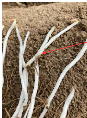
Rhizoctone brun sur tiges— variété Jazy plantée de 20/04—secteur Douai