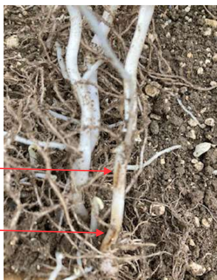
Rhizoctone brun sur tiges— variété Colomba plantée de 5/04—secteur Douai

Les premiers symptômes sur tiges (taches brunes) nous ont été signalés dans le secteur de Douai.