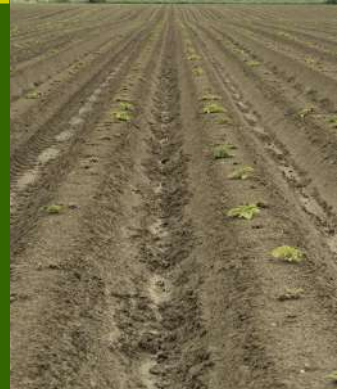
Fontane plantée le 22 avril — 50% de levée—Saint Saulve (59).

OBSERVATIONS : 1 tas de déchets et 36 parcelles ont été observés cette semaine.