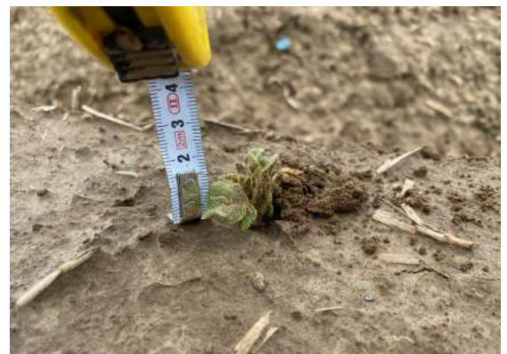
Variété Challenger plantée le 22 avril— Stade « cracking » Comines (59)