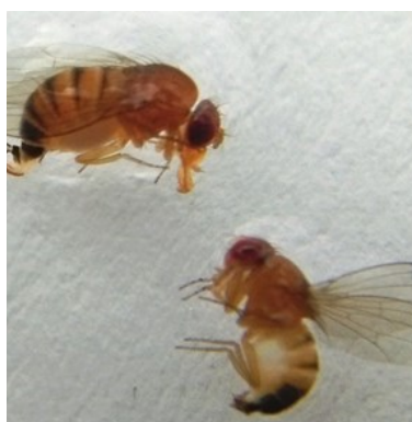
Drosophiles mâles (C BLANCKAERT CA59/62 )

Une récolte tous les deux jours est le meilleur moyen de limiter les dégâts.