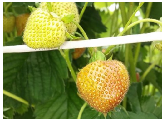
Dégât de thrips