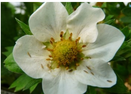
Thrips dans fleur de fraisier

Il reste cependant important de suivre l'évolution des populations en installant des panneaux englués, et en réalisant des observations régulières, et ce, plus particulièrement dans les parcelles concernées historiquement.