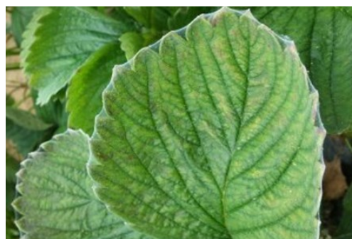
Dégâts d'acariens tétranyques : formation de toiles