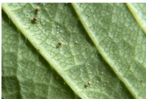
Acariens tétranyques : œufs et adultes (C BLANCKAERT CA59/62 )

Dans les parcelles où de premiers acariens ont été observés, mais aussi en prévention, il est possible d'introduire des auxiliaires prédateurs sous abris.