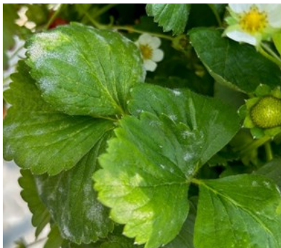
Oïdium sur feuille (C BLANCKAERT CA59/62 )

Les parcelles de plein champ sont généralement moins exposées (moins d'écarts de températures).