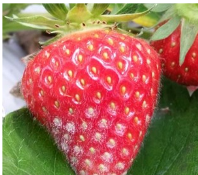
Oïdium sur fruit