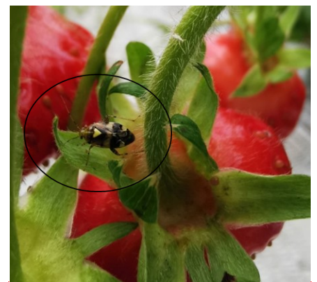
Punaise adulte sur fraise (Cécile BENOIST CA59/62)