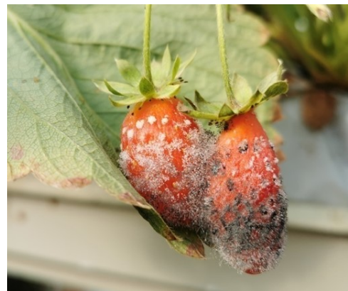
Rhizopus sur fruits (Cécile BENOIST CA59/62)

Retirer les fruits atteints permettra d'éviter la prolifération du champignon dans la parcelle.