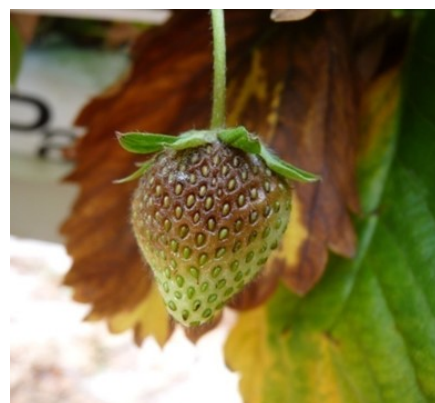
Botrytis sur fruit (Cécile BÉNOIST CA59/62)

Concernant les fruits touchés, il faut les éliminer pour éviter qu'ils ne contaminent leurs voisins.