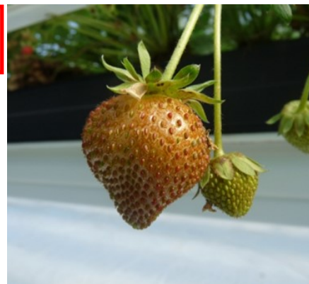
Dégât sur fruit (Cécile BENOIST CA59/62)