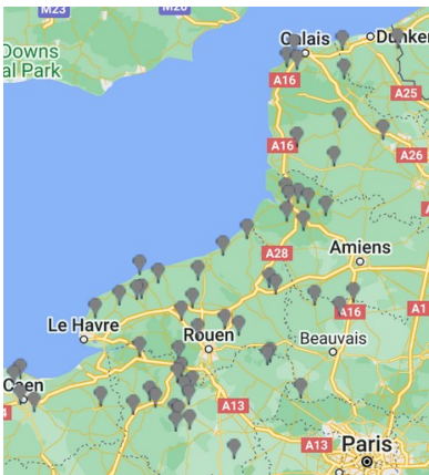
Réseau d'observation cette semaine

Cette semaine, le réseau est constitué de 37 parcelles :