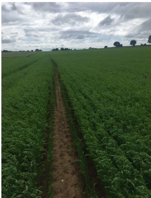
Lin du 14 avril – 50 cm

Les derniers semis (autour du 10 avril) généralement situés en Hauts de France atteignent 50 à 70 cm et profitent des dernières pluies.