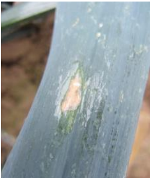
Mildiou sur poireau (FREDON HdF)