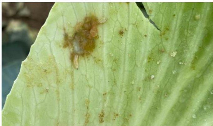
Larve de mouche et dégâts de thrips (Natur'Coop)

Attention de bien stocker des choux sains pour éviter la proliférations des attaques surtout en stockage précaire.