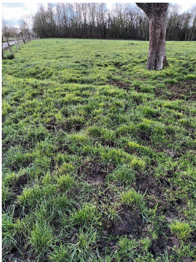
Dégâts engendrés par les problèmes de portance